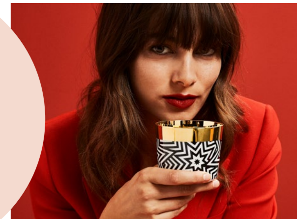
Sip of Gols Champagne tumblers for Sieger by Fürstenberg ©sieger.

FUNCIONALIDAD, INNOVACIÓN Y DURABILIDAD SE UNEN EN SUS PRODUCTOS, QUE SON TESTIMONIO DE SU INSTINTO EXCEPCIONAL PARA LAS TENDENCIAS