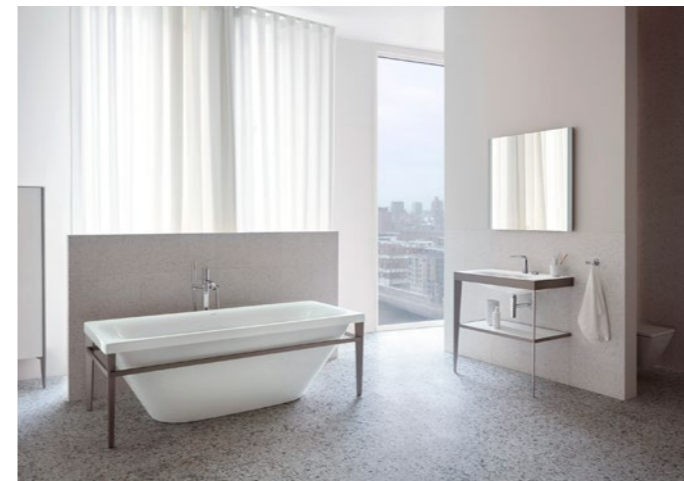
Viu XViU de Duravit.