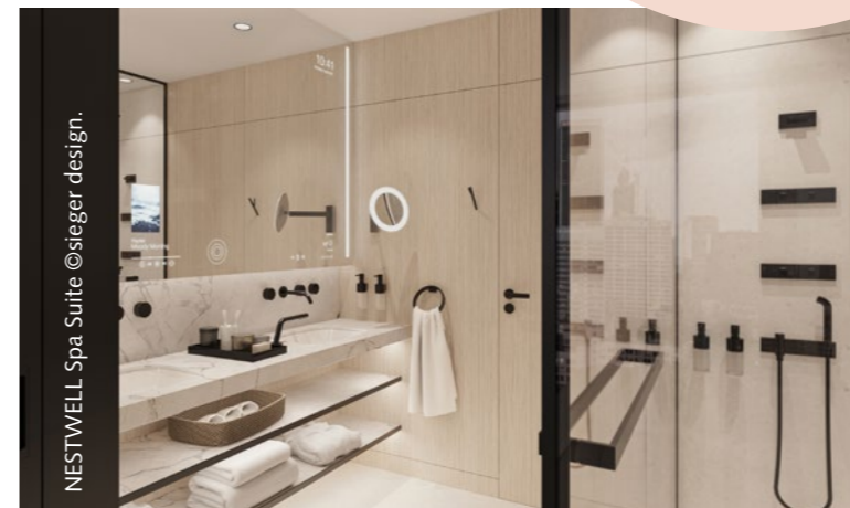
NESTWELL Spa Suite ©sieger design.