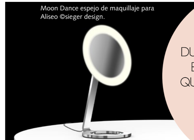
Moon Dance espejo de maquillaje para Aliseo ©sieger design.

FUNCIONALIDAD, INNOVACIÓN Y DURABILIDAD SE UNEN EN SUS PRODUCTOS, QUE SON TESTIMONIO DE SU INSTINTO EXCEPCIONAL PARA LAS TENDENCIAS