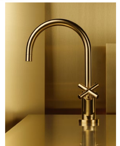
Tara Brushed Durabrass by Dornbracht.