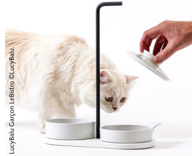
LucyBalu Garçon LeBistro ©LucyBalu.

ha trabajado en sectores tan dispares como el de la iluminación, la automoción, ha diseñado vajillas, chimeneas, televisores, cafeteras y ha llevado a cabo proyectos de interiorismo y arquitectura como el Teatro de Münster, el restaurante alemán Villa Medici... Los hermanos Sieger entienden el diseño como un concepto global. Cada nuevo proyecto se aborda con gran sensibilidad, un ojo para las formas atemporales, a menudo arquetípicas, la delicadeza técnica superlativa y la artesanía, y un don para la funcionalidad, la innovación y la durabilidad. Con largos ciclos de vida, éxito medible y prestigiosos premios de diseño, las líneas de productos que diseñan son testimonio de su instinto excepcional para las tendencias.