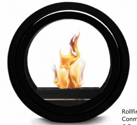
Rollfire para Conmoto