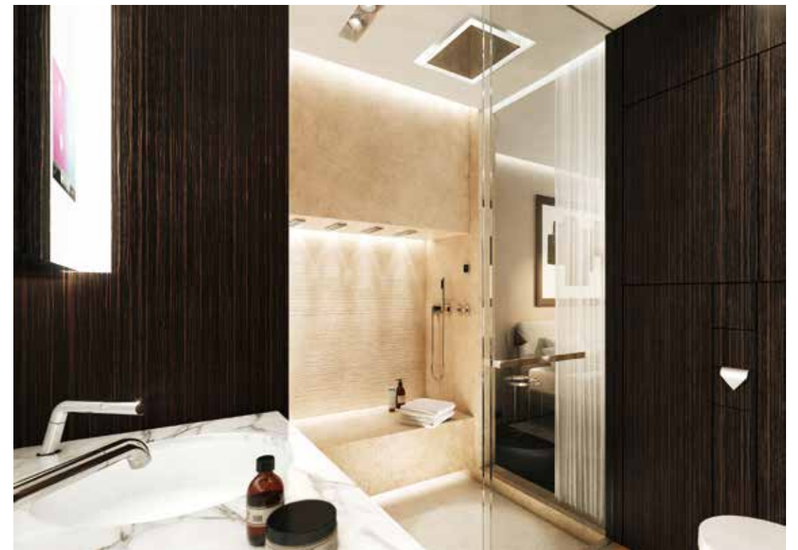
seiger design SSPS® Comtemporany 系列設計概念, ©seiger design