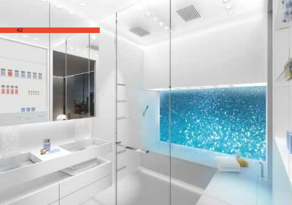
seiger design SSPS® Broadening Horizons 系列設計概念, ©seiger design