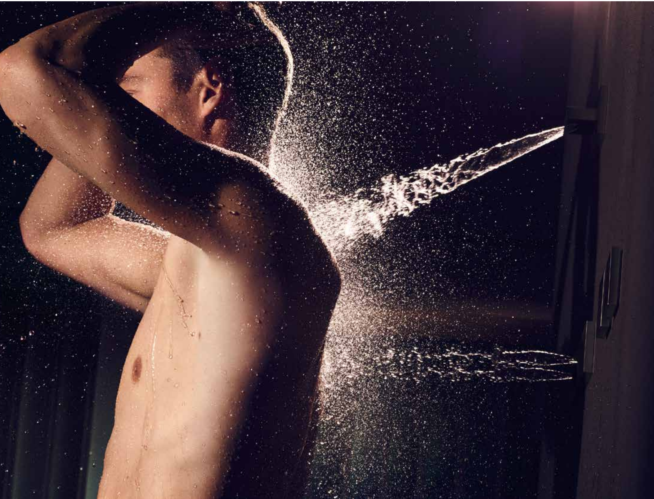
seiger design 與 Dornbracht 合作推出的 WaterCuve 與 WaterFan 按摩噴嘴系統, ©Dornbracht