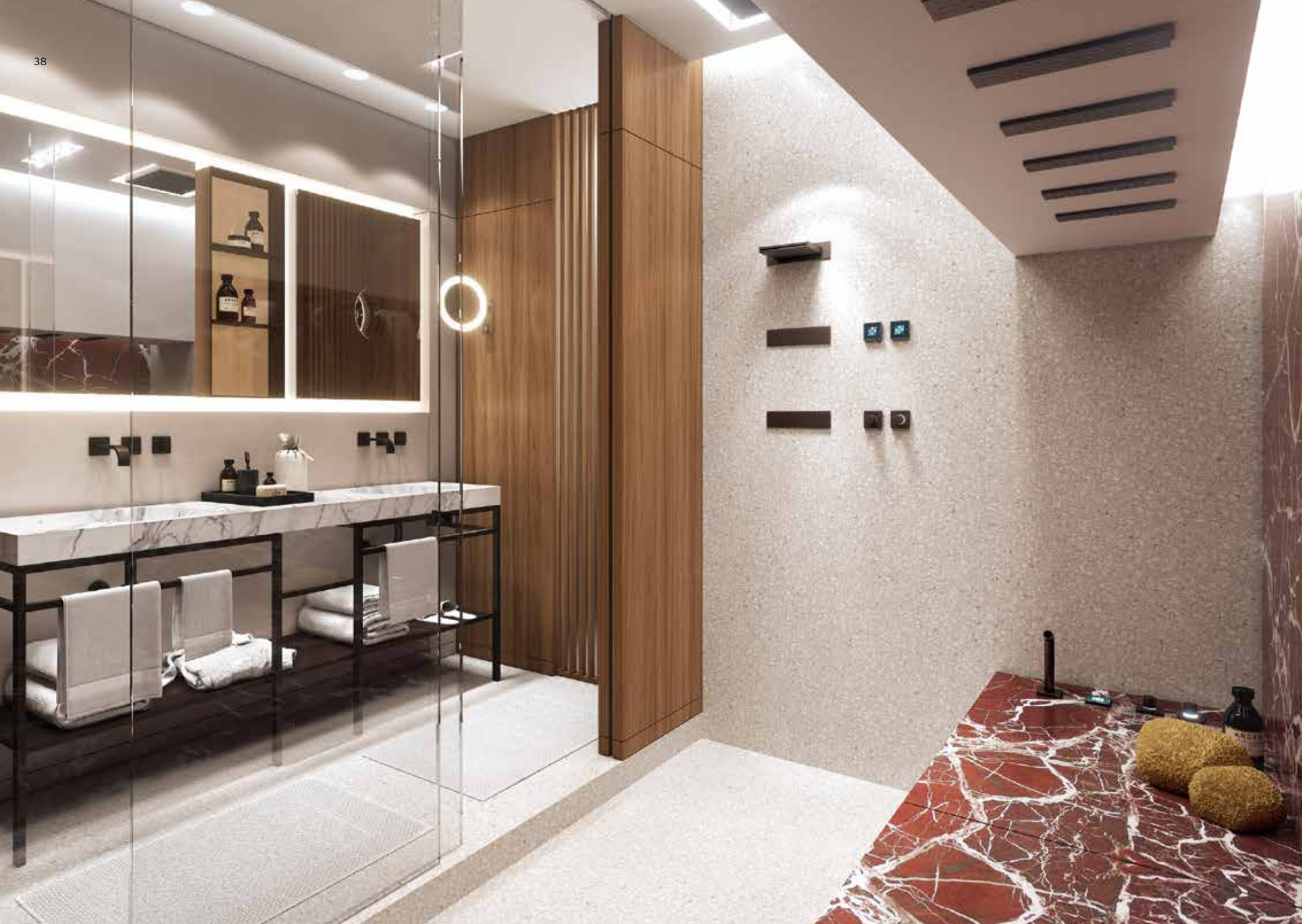
seiger design SSPS® Suite 2017年套房設計, ©seiger design