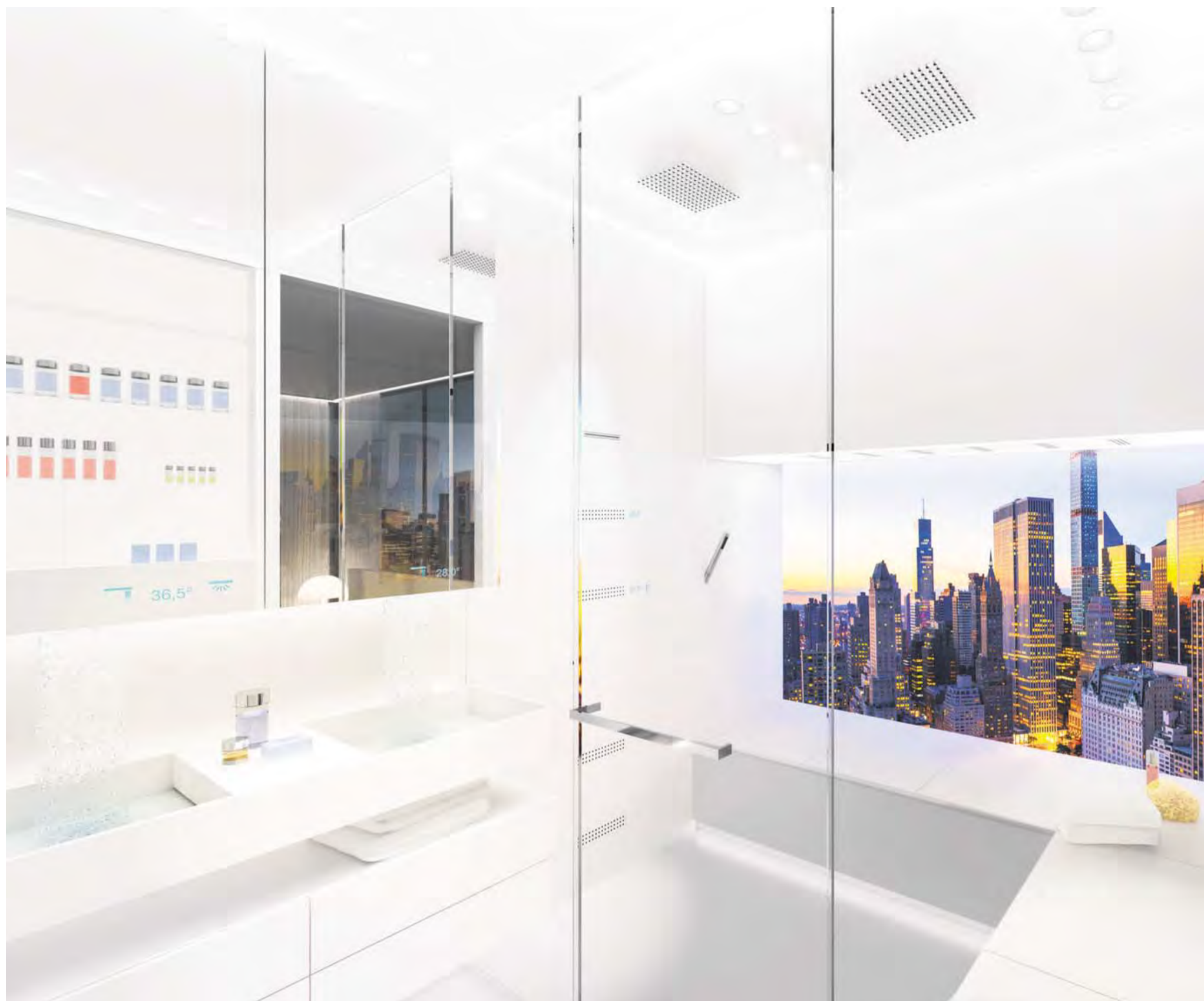
Sieger Design tilpasser deres produkter til de globale samfundstrends. Derfor har de udviklet badeværelseskonceptet "Small Size Premium Spa", der er et luksuriøst badeværelsesdesign til lejligheder med rum på ned til seks kvm.

► sikre, der bliver stillet skarpt på designets livscyklus. Vi skal overtale folk til at købe et produkt én gang i stedet for at blive ved med at skifte ud. Alle ved, at hvis man køber et par rigtigt god sko, så holder de længere end en enkelt sæson,« fortæller han fra sit kontor på slottet i Harkotten.