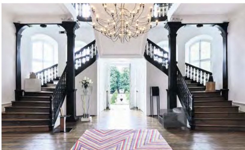
Sieger-familiens Harkotten Slot er indrettet til at inspirere designvirksomheden.